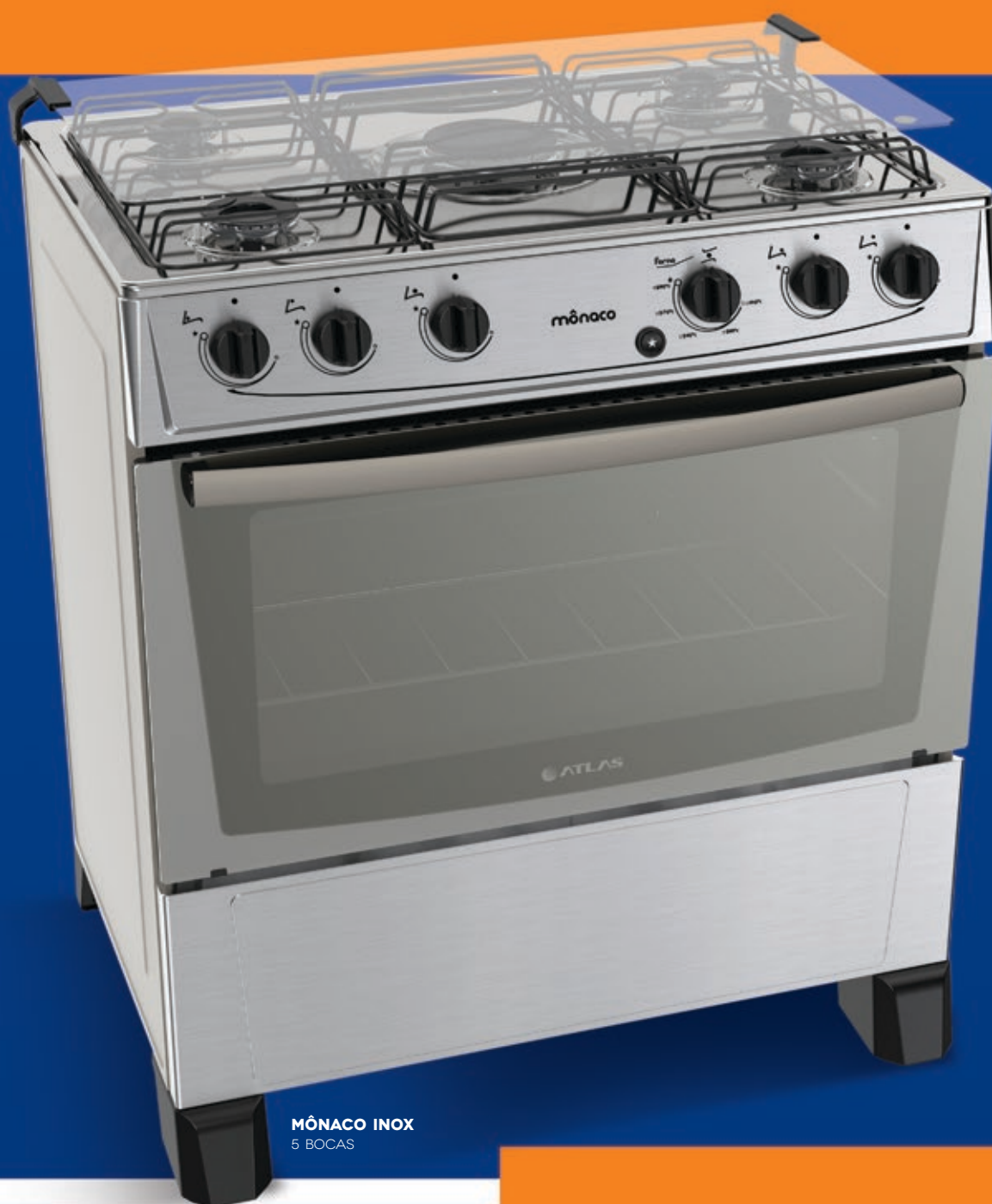
MÔNACO INOX 5 BOCAS