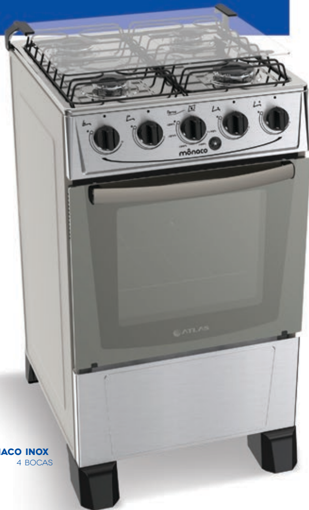
MÔNACO INOX 4 BOCAS