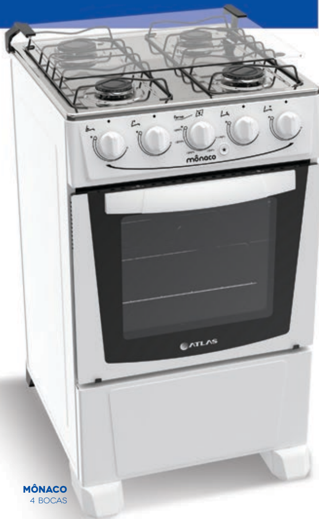
MÔNACO 4 BOCAS